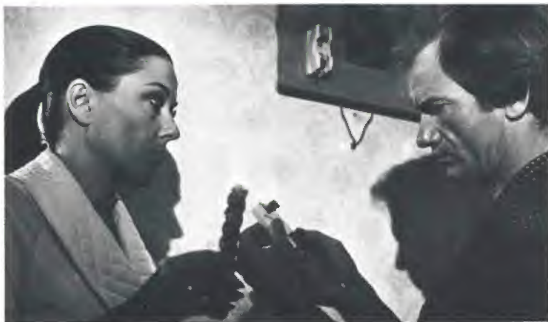
Mónica Randall - Simón Andreu